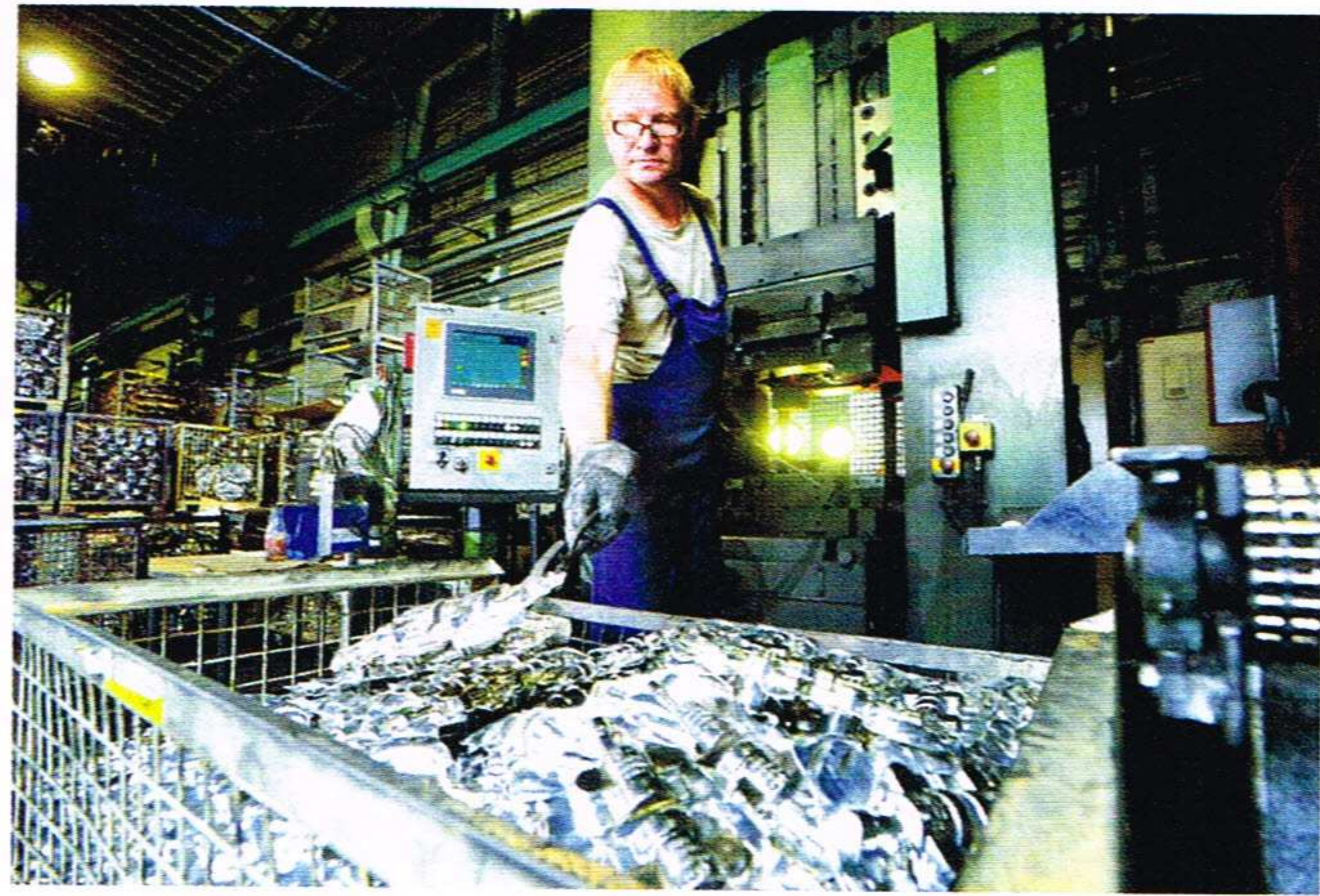
Bei UFT in Radebeul wird auf sieben Pressen produziert